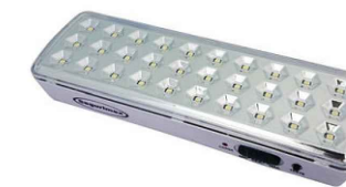
MÓDULO AUTÔNOMO DE ILUMINAÇÃO DE EMERGÊNCIA, COM 30 LED'S OU MENOS, 100 LÚMENS, 3W, AUTONOMIA MÍNIMA DE 1HORAS