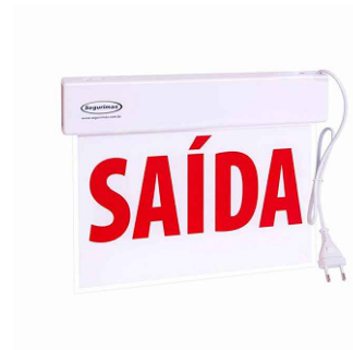
MÓDULO AUTÔNOMO DE SINALIZAÇÃO DE ABANDONO (SAL), LED, 30 LÚMENS, 1.3W, AUTONOMIA MÍNIMA DE 1HORAS. DIMENSÕES INDICADAS EM PROJETO.